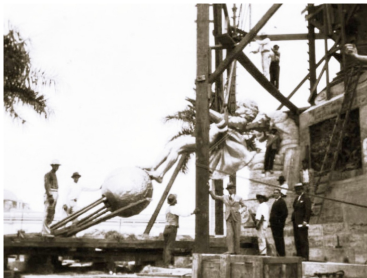
Montaje del Monumento de La Libertad (Fuente: delynesdetrujillo.blogspot.com).

Y, en una postal anexa al envío de su libro " Die Inka in Europa ", Heck me contaría que felizmente pudo observar por breves momentos que las escalinatas de la obra de Moeller estaban sin personas sentadas... ¡Justo la última tarde de su estadía en nuestra ciudad!