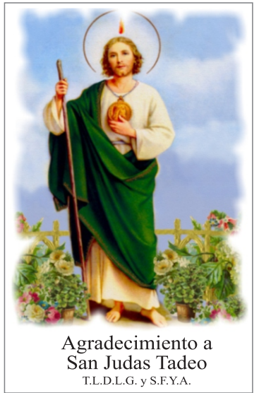
Agradecimiento a San Judas Tadeo T.L.D.L.G. y S.F.Y.A.