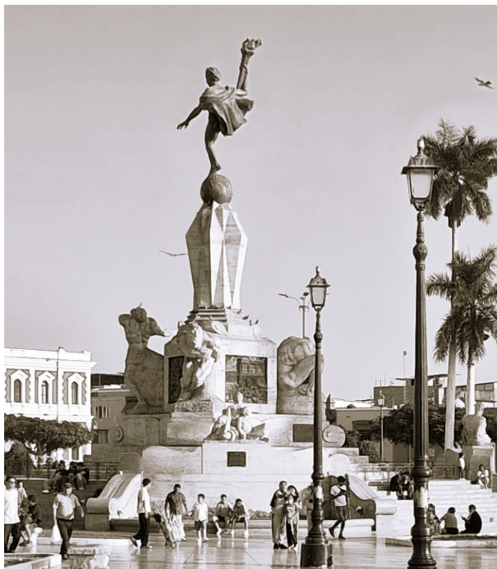
Escalinatas del primer nivel del monumento usadas indebidamente como asientos.

templar el monumento desde diversas distancias y ángulos, se trastocó en sorpresa y molestia cuando vio que las escalinatas del primer nivel de esta obra de arte... ¡Servían de asiento a un importante grupo de personas, al igual que otras partes del basa-