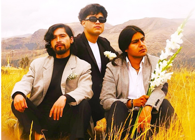
Estación Abisal, desde Huancayo, ya entró al ranking.