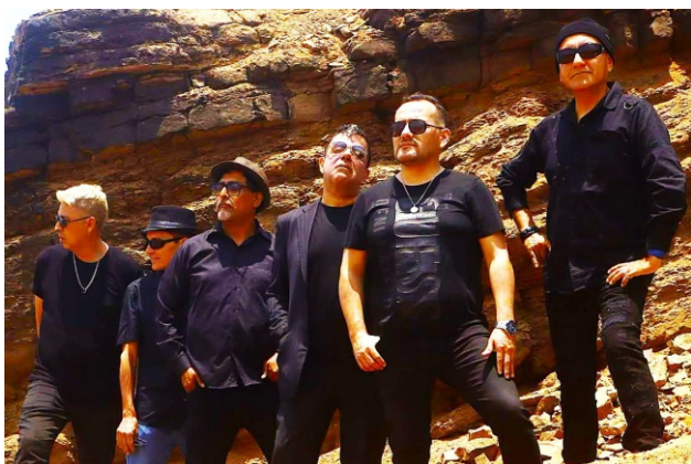
Cardenales, leyendas del pop rock peruano, vuelven a escena con estreno.