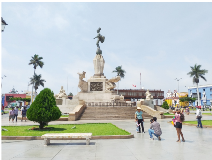
Vista inusual del Monumento de La Libertad sin gente en las escalinatas.