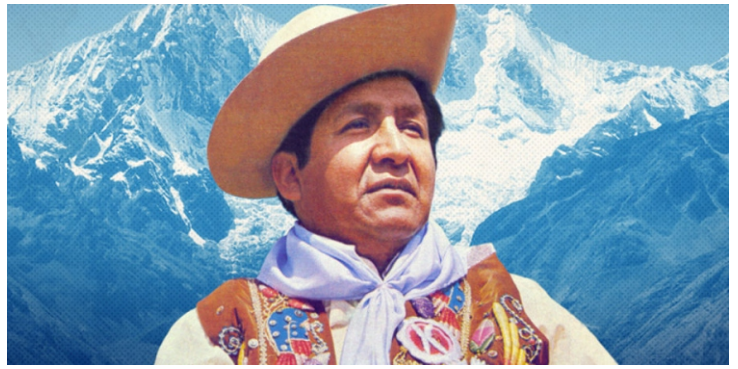
El legendario Picaflor de los Andes.

que las interpretan, nos regalan una experiencia sensorial y cognitiva invaluable al escucharlas, bailarlas y disfrutarlas en eventos festivos y rituales que nos acompañan en actividades como la agricultura, el pastoreo, la limpieza de canales, la pesca, el techado de casas, entre otras acciones de nuestro día a día. Es considerada una celebración cargada de historia y tradición.