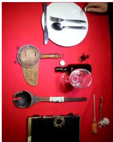
La cucharita (ARRIBA, en la mano del director), otros personajes y utilería (Fuente: El Botón Teatro y Títeres).

No quisiera concluir sin mencionar que la presentación de “El Caso de una Cucharita” incluyó al final un enriquecedor conversatorio, donde los asistentes emitieron sus apreciaciones libremente y el creador de la misma compartió su rica experiencia profesional.