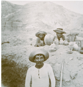
Viejo huaquero (detalle-).

Pero, en este caso nos referimos a un pasaje de la novela “ País de Jauja ” (Edición limeña de 2013) de Edgardo Rivera Martínez ; y sería gracias a la me-