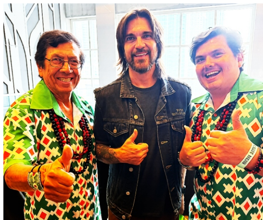
Los Mirlos y Juanes, en dupla para tremendo estreno.

Revisa nuestras listas en las ediciones anteriores de La Guía Semanal y escúchalas el playlist de YouTube: Abre-Lista 2026 .