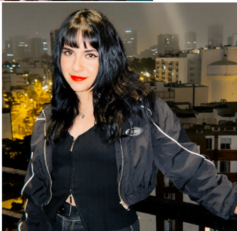
ARRIBA: Roxie llega con una carga intensa de rock pop para excelente estreno. DERECHA: Berry, desde Cusco, también entró a la Lista Semanal.