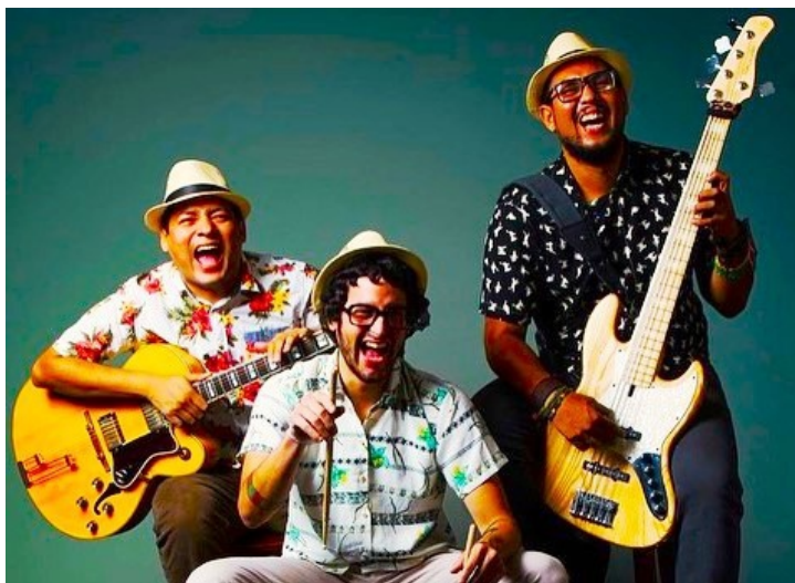
IZQUIERDA: Vieja Skina, banda ska, ingresó al ranking.