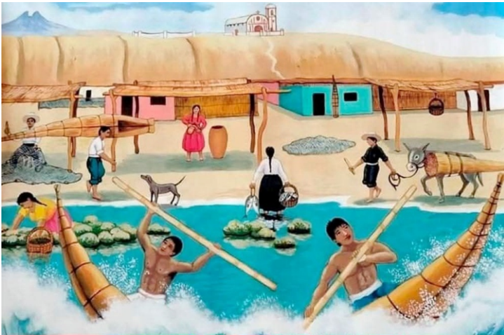
Caleta de Huanchaco.