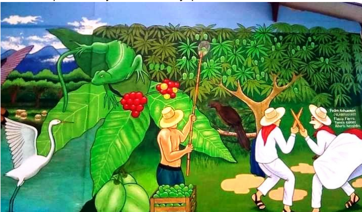
IZQUIERDA: Flora y Fauna de Atoyac (mural, detalle).

Además, ha dictado charlas sobre el patrimonio cultural del Perú en diversas instituciones y, desde el 2013, labora en el Ayuntamiento Municipal de Atoyac de Álvarez (Estado de Guerrero) como maestro de artes plásticas y artesanías y pintor muralista de Casa de la