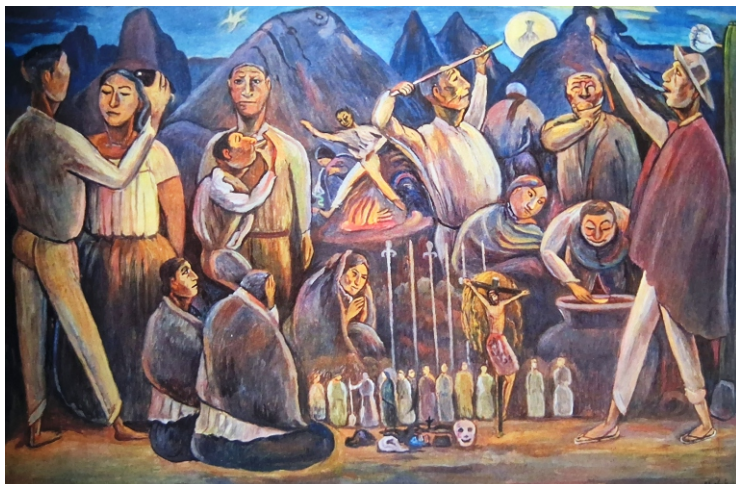
El curanderismo (óleo).

El tema del “ embrujo ” no fue ajeno a la vida de Don Pedro Azabache (†), renombrado discípulo de José Sabogal ; de ahí que el curanderismo fue uno de los numerosos temas pintados por él durante su fructífera labor artística.