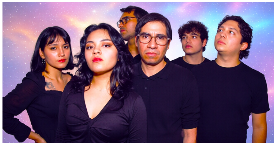
Cósmica , banda trujillana que se estrena con EP.

La entrada al concierto es gratuita y se espera una gran presencia de los fans de la música. Este evento cuenta con el auspicio de la Fundación Cultural del Banco de la Nación, la Guía Semanal de Trujillo y AbreLista - Ranking Musical Peruano.