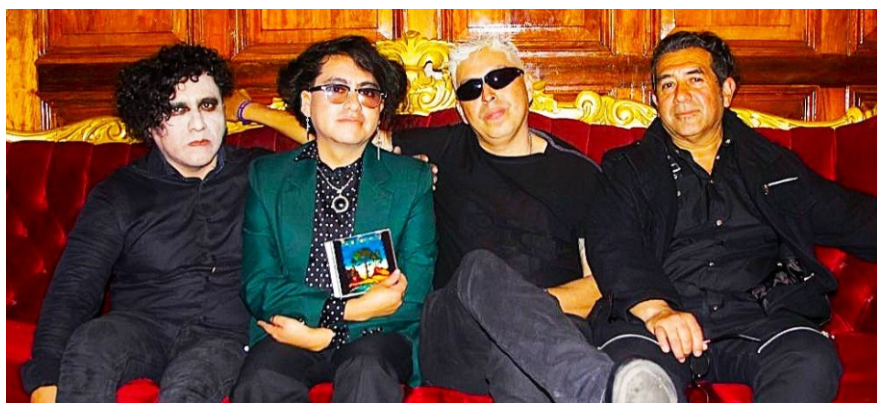
Jardín Nocturno, desde Huancayo al ranking.