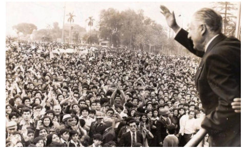
Mitín de Fernando Belaúnde en Arequipa.

nas de zonas urbanas, o sea que votaba una de cada 20. Hoy en día vota uno de cada dos. Las mujeres peruanas votan por primera vez en 1956. El Perú fue el penúltimo país de América Latina que