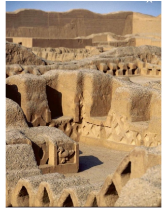
En 1929, reconoce y explora en la costa norte los valles del Santa, Virú, Moche, Chicama, etc., determinando dedicarle más tiempo a los grandes sitios del Sol y la Luna (Moche) y Chan Chan.

Desde 1919 hasta su fallecimiento, el Dr. Julio C. Tello ejecutó cinco grandes expediciones arqueológicas peruanas a diferentes regiones de nuestro territorio, habiendo –además– realizado otras exploraciones, reconocimientos y visitas de menores alcances a un 60% del territorio peruano.