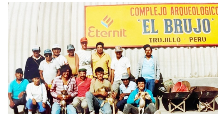
Parte del grupo pionero, junto al almacén de El Brujo.

A la ardua tarea de campo cotidiana, seguía una etapa de apacible estadía en un pueblo que poco a poco se fue acostumbrando a los recién llegados, a la par que sucesivos grupos de caveros (así se denomina a los nacidos en Magdalena de Cao) engrosaban el