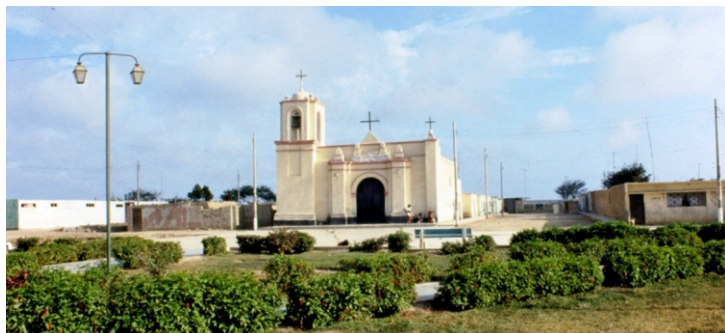
Plaza de Magdalena de Cao, en agosto de 1990.