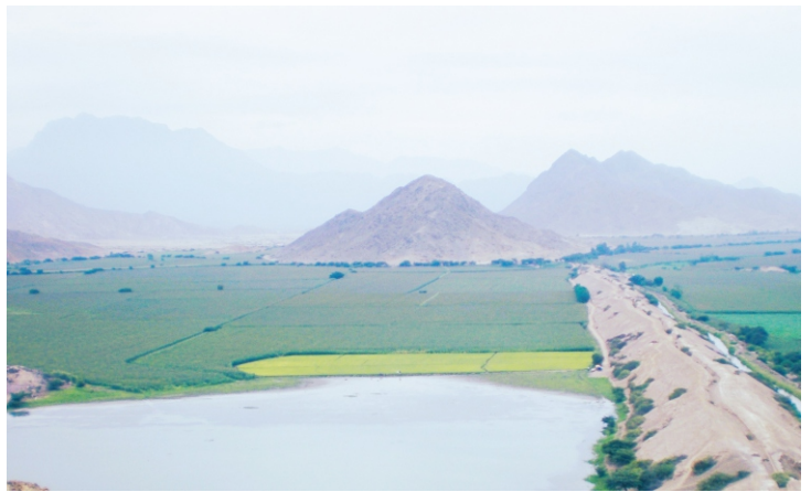
El Cerro San Bartolo, en el centro, junto a campos de cultivo.

sur del Cerro San Bartolo, motivó la leyenda “El pie de San Bartolo”, recogida a inicios del siglo XX por el poeta José Gálvez Barrenechea; según la cual fue el punto de descenso de aquel santo luego de ganar una maratón al diablo dando un tremendo salto.