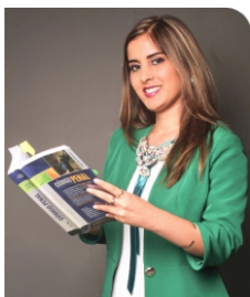
Por: JOSELYN MICHELLE ANTINORI D'ANGELO