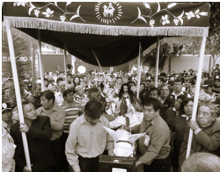
Recorrido de imagen en acémila en Domingo de Ramos - Moche.

Al Domingo de Ramos le siguen las procesiones de varias imágenes: Señor del Huerto (lunes), Señor de la Columna (martes), Jesús de Nazareno (miércoles), Señor de los Milagros, la Virgen Dolores, la Virgen Soledad, la Virgen Verónica, el Cristo de la Inspiración y el Señor del Auxilio (jueves). A lo cual sigue el Santo Descendimiento y la colocación de la imagen en su Santo Sepulcro (viernes), otra procesión, la mi-