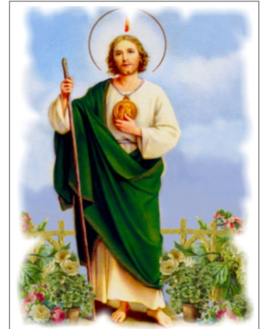
Agradecimiento a San Judas Tadeo T.L.D.L.G. y S.F.Y.A.

En la fase de grupo, la UPAO derrotó a la Universidad Nacional Mayor de