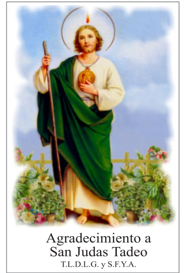
Agradecimiento a San Judas Tadeo T.L.D.L.G. y S.F.Y.A.

Solo los ganadores del primer lugar en cada disciplina clasificarán a la fase internacional