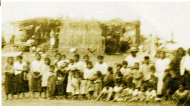
ARRIBA: Espectadores ascopanos ubicados fuera del ruedo.