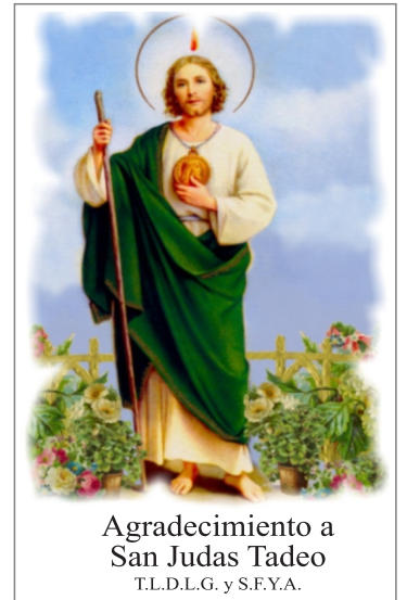
Agradecimiento a San Judas Tadeo T.L.D.L.G. y S.F.Y.A.

nuevo paso tiene un significado especial: “La Escuela de Música Carlos Arancibia nació del esfuerzo constante y de la confianza de las familias que creyeron en este proyecto desde el inicio. Volver a Las Quintanas con una segunda sede no es solo expandirnos; es honrar nuestras raíces y demostrar que cuando el trabajo es en equipo, los sueños crecen junto a la comunidad.”