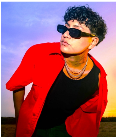
Skillbea, en la vanguardia de los estrenos.