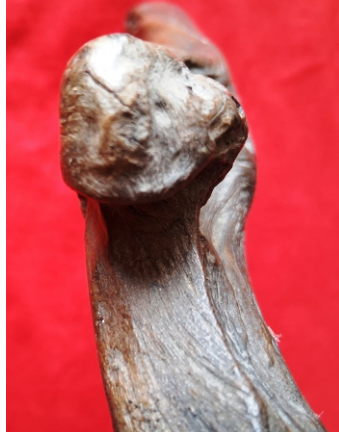
Detalle de cara 1 ‘palo de visión’ (Foto C. Gálvez).