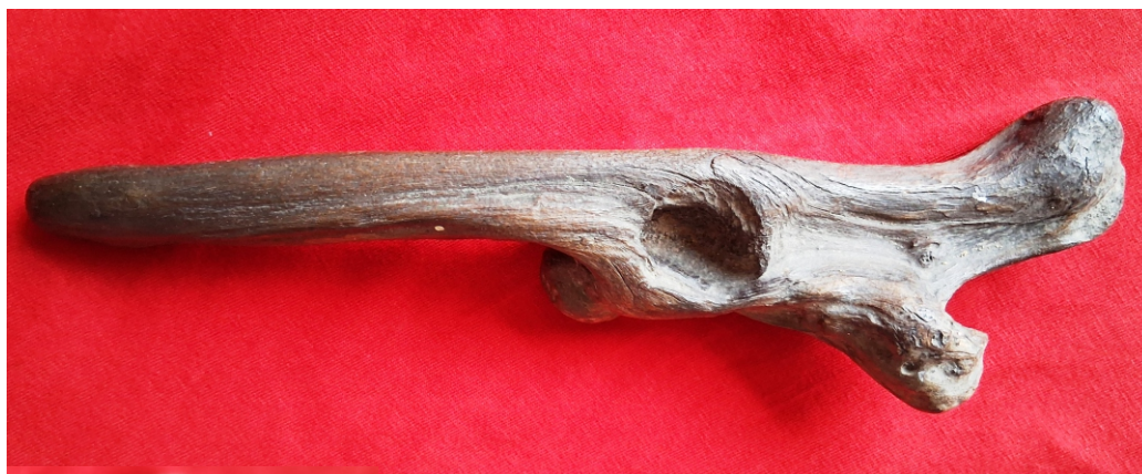
ARRIBA: ‘Palo de visión’.

clinara una y otra vez el objeto aprovechando la luz del sol, tarea nada fácil cuando uno no tiene “ ojos para ver ”. En mi caso, apenas pude hallar cuatro de estas “ caras ” luego de muchos intentos. El “ palo de visión ”, además de desa-