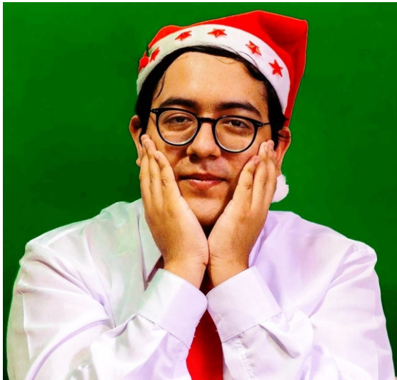
ARRIBA: Gorgory, desde Chiclayo llega con canción navideña de estreno.