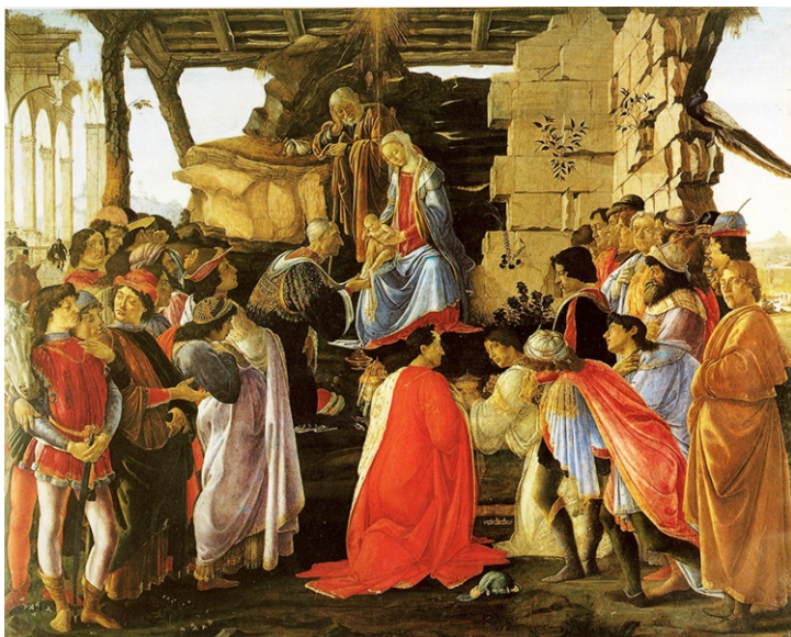
Sandro Botticelli. Adoración de los Magos. Hacia 1475. Galería de los Uffizi. Florencia.

El evangelio según San Mateo es el único que narra la Adoración de los Magos. Se trata de un relato muy escueto que ofrece numerosos interrogantes, ya que simplemente se alude a ellos como a unos magos venidos de oriente. Se considera que los magos pudieron proceder de Persia porque con el vocablo “mago” eran denominados los sacerdotes persas de Zoroastro, religiosos expertos en astronomía y astrología. También podrían proceder de Arabia, más cercana a Palesti-