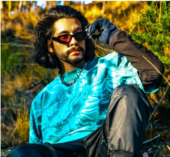
IZQUIERDA: Jeddu estrena buena canción y se proyecta para el 2026.