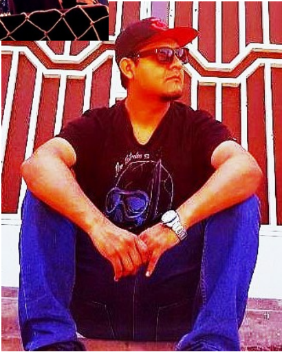
ABAJO: Tremendo Latino, el hip-hop trujillano está en la lista semanal.