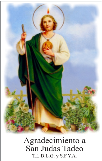
Agradecimiento a San Judas Tadeo T.L.D.L.G. y S.F.Y.A.