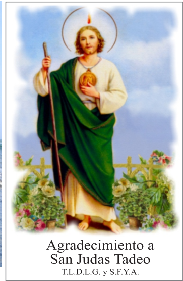
Agradecimiento a San Judas Tadeo T.L.D.L.G. y S.F.Y.A.

Huanchaco, durante los siglos XVI al XIX fue un puerto peligroso. Los navíos fondeaban a media legua de la playa pues a un cuarto de legua se entraba a una zona de peñascos y arena, que comúnmente le llamaban Tasca . Sólo la práctica y conocimiento de los “ indios pescadores ” sobre balsas y caballitos de totora permitieron que las lanchas y botes salieran con éxito del peligro, aunque muchas veces fue necesario el uso de un andarivel para mayor seguridad. Aún así fueron muchas las desgracias y pérdidas ocurridas debido a la Tasca y el fuerte oleaje. Tal circunstancia fue la mejor defensa que tuvo Trujillo. El peligro que significaba el desconocimiento de la playa no permitió –nunca– la invasión de enemigos marinos. Los corsarios y piratas jamás se atrevieron a desembarcar en sus costas. Aún así, la constante presencia de tan terrible amenaza alentó a los trujillanos a amurallar su rica ciudad. Según el fervoroso cronista del siglo XVII Castro Domonte, fueron Nuestra Señora del Socorro de Huanchaco , por el Norte, y el Cristo del pueblo de Santiago de Huamán , por el Sur, los auténticos y únicos defensores de Trujillo del Perú.