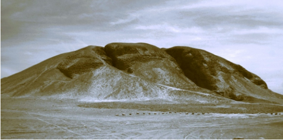
Huaca El Brujo (o Cortada) mencionada como el fantástico lugar del hallazgo.