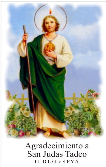
Agradecimiento a San Judas Tadeo T.L.D.L.G. y S.F.Y.A.