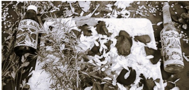
DERECHA: Elementos para baño de florecimiento.

A ello, las “curiosas” agregan agua de florida, perfume tabú, azúcar blanca, jugo de lima; y se estima que para que el baño tenga efecto no se debe usar toalla ni jabón, y la mezcla debe secar al aire libre, siendo necesario realizar al menos tres baños. A una de estas “curiosas” nosotros la visitamos camino a Sinsicap (provincia de Otuzco). Otras personas prefieren acudir a un curandero para una sesión de florecimiento, a partir de la cual obtendrán un “seguro” (frasquito con hierbas) que, aseguran, los protegerá de malas influencias y les atraerá la buena suerte.