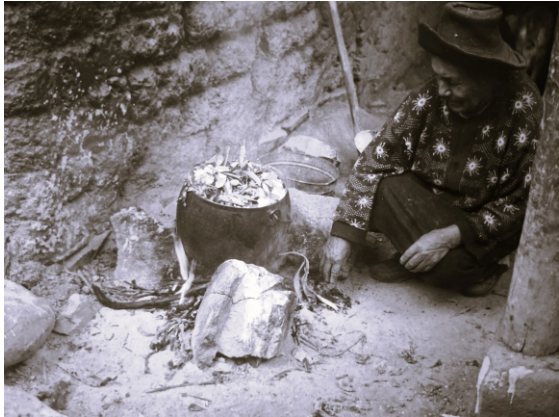
ARRIBA: Curiosa preparando baño de florecimiento (Sinsicap) (Foto C. Gálvez).

En pueblos tradicionales de La Libertad no es extraña la búsqueda de la buena fortuna en el amor y la vida, a fin de evitar la “saladera”; es decir el hecho que las cosas “salgan mal”, a pesar de todo esfuerzo personal. Afán que no es ajeno para quienes viven en las ciudades. Con esta finalidad se recurre a varias opciones, una de las cuales son los baños de florecimiento, que usualmente preparan “curiosas” entendidas en estos menesteres, y consiste en hervir un conjunto de plantas que -se cree- limpian a las personas de malas influencias y las