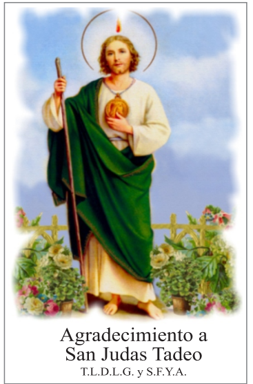
Agradecimiento a San Judas Tadeo T.L.D.L.G. y S.F.Y.A.

La UNM expresa sus mejores deseos a sus estudiantes y celebra este importante logro compartido.