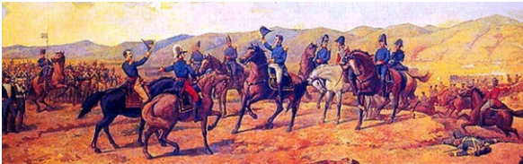
El ejército libertador, en la Pampa de la Quinua, comandado por Antonio José de Sucre.