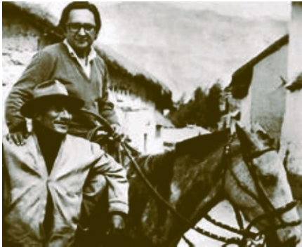
Manuel Scorza (1928-1983).

La novela Redoble por Rancas (1970), de Manuel Scorza (1928-1983), incluye menciones a potajes norteños, degustados en ocasiones especiales en Yanahuanca (departamento de Cerro de Pasco) por los notables de entonces. Así, entre los platos de la kermés organizada por doña Josefina de la Torre, directora de escuela de niñas, están “...el lujurioso arroz con pato a la chiclayana, el pícaro cabrito a la norteña”, los cuales también serían mostrados bajo carpas en Yanahuanca, el 1 de noviembre de 1959, mientras en un escenario opuesto los campesinos de Rancas asistían modestamente a visitar a sus muertos.