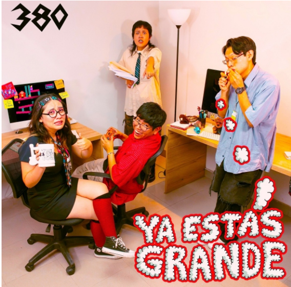
ARRIBA: 380, la banda punk arequipeña sacó nuevo album y entra a la Lista.