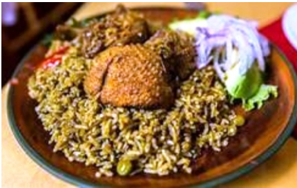
Arroz con pato.

La novela Redoble por Rancas (1970), de Manuel Scorza (1928-1983), incluye menciones a potajes norteños, degustados en ocasiones especiales en Yanahuanca (departamento de Cerro de Pasco) por los notables de entonces. Así, entre los platos de la kermés organizada por doña Josefina de la Torre, directora de escuela de niñas, están “...el lujurioso arroz con pato a la chiclayana, el pícaro cabrito a la norteña”, los cuales también serían mostrados bajo carpas en Yanahuanca, el 1 de noviembre de 1959, mientras en un escenario opuesto los campesinos de Rancas asistían modestamente a visitar a sus muertos.