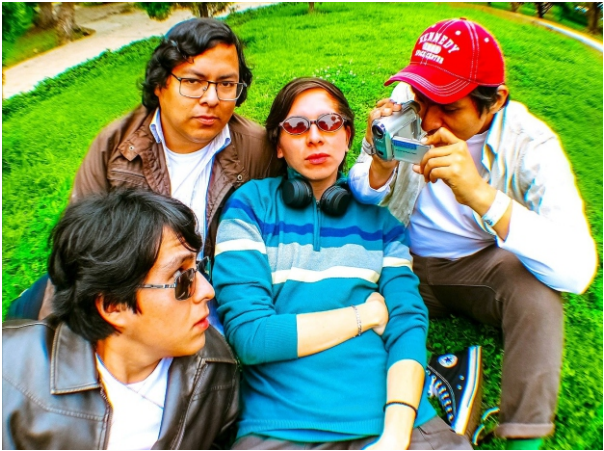
IZQUIERDA: 380, la banda punk arequipeña sacó nuevo album y entra a la Lista.