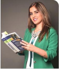
Por: JOSELYN MICHELLE ANTINORI D'ANGELO