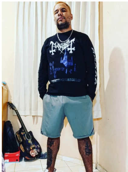
Evos - Tumbes en Estrenos.