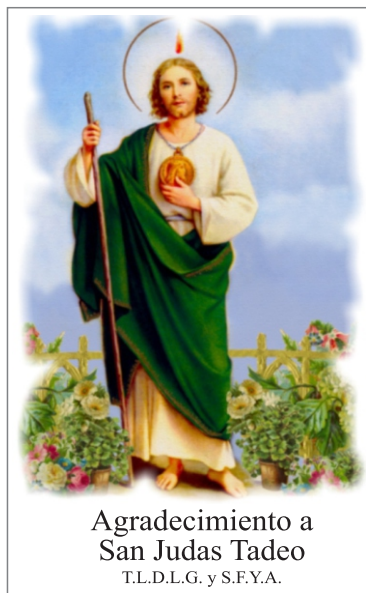
Agradecimiento a San Judas Tadeo T.L.D.L.G. y S.F.Y.A.